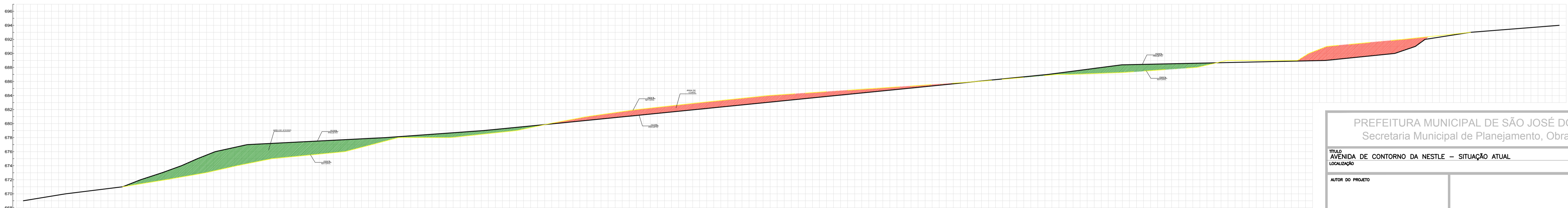
PERFIL TRANSVERSAL- S9 1:300