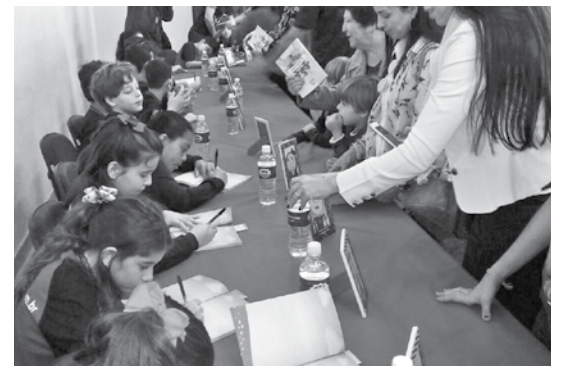
Os escritores mirins em manhã de autógrafos

Art. 3º - Fica o Setor de Contabilidade encarregado de realizar as alterações e ajustes necessários nos demonstrativos e anexos da Lei das Diretrizes Orçamentárias nº 4.713, de 26 de agosto de 2016 e da Lei do Plano Plurianual nº 4.174 de 06 de dezembro de 2013, quadriênio 2014/2017. Art. 4º - Este Decreto entra em vigor na data de sua publicação. São José do Rio Pardo, 23 de junho de 2017. Ernani Christovam Vasconcellos, Prefeito. Publicada por afixação em quadro próprio de editais na sede da Prefeitura Municipal, na mesma data. Reinaldo Milan, Secretário Municipal de Gestão Pública.